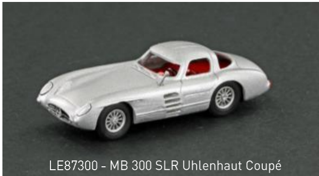
LE87300 - MB 300 SLR Uhlenhaut Coupé

1:87 Kunststoff Modell, sehr detaillierte Ausführung, filigrane Felgen, Länge: 50mm