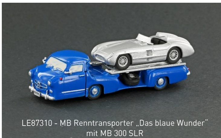
LE87310 - MB Renntransporter „Das blaue Wunder“ mit MB 300 SLR

1:87 Kunststoff Modell-Set, sehr detaillierte Ausführung und Bedruckung, filigrane Felgen, Länge: 79mm