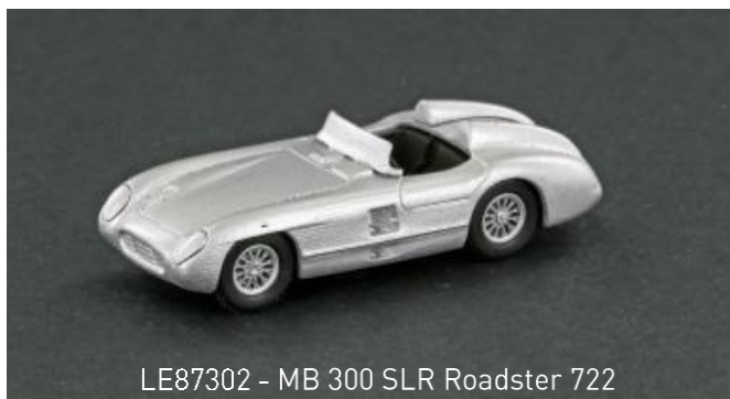
LE87302 - MB 300 SLR Roadster 722

1:87 Kunststoff Modell, sehr detaillierte Ausführung und Bedruckung (mit Union Jack Flagge), filigrane Felgen, Länge: 49mm